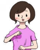
※いーとーまきまき いーとーまきまき