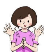
でーきた でーきた