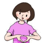
①こびとさんのおくつ