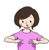
ひーいて ひーいて